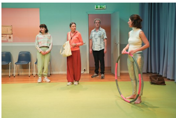
Theater Tristero speelt deze dagen 'Circle Mirror Transformation' van Annie Baker.

Misschien kenden ze ook nog de Franse versie van The Antipodes die in 2022 door het Cannine Collectif én ... TG Stan werd gespeeld. Daarin bracht een schare Vlaamse topacteurs, met onder meer Els Dottermans en Robby Cleiren , deze tekst uit 2017 ... in het Frans. De Nederlandse bewerking van The Flick (in 2018) kenden ze misschien ook.