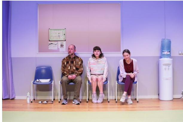
Het Brusselse theatercollectief Tristero is de uitzondering op de regel en speelt 'Circle Mirror Transformation' van de Amerikaanse Annie Baker.